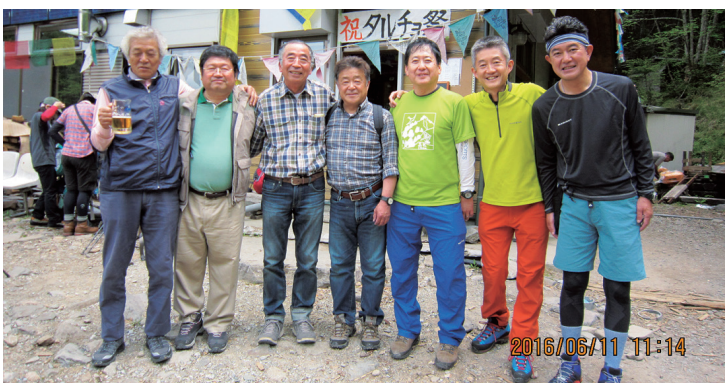
平成 28 年 (2016)