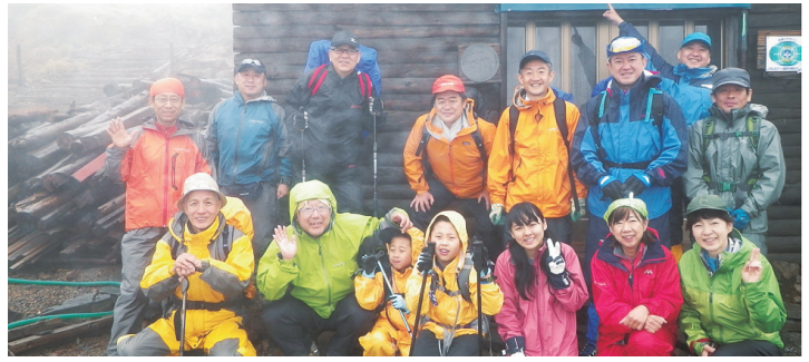
平成 25 年 (2013)