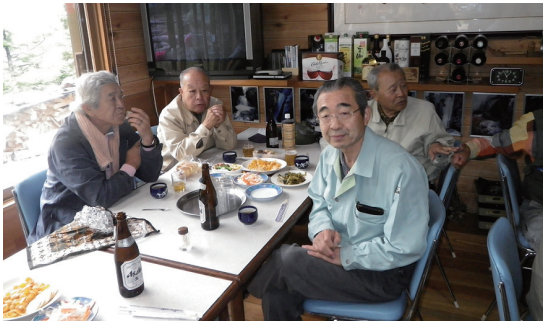
平成 23 年 (2011)